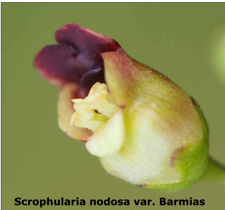
Scrophularia nodosa var. Barmias

Lieux humides, sur le Lot, Tarnon bassin et la Mimente